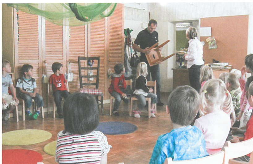
Die vielen verschiedenartigen Aspekte im Tagesablauf eines Hauswarts.

Die Problematik ist ähnlich wie oben beschrieben. Die Reinigungsfirma erhält einen Auftrag für die Reinigung. Wenn aber die Haustür nicht mehr richtig funktioniert oder die Treppenhausbeleuchtung streikt, ist sie gemäss Auftragsbeschreibung nicht