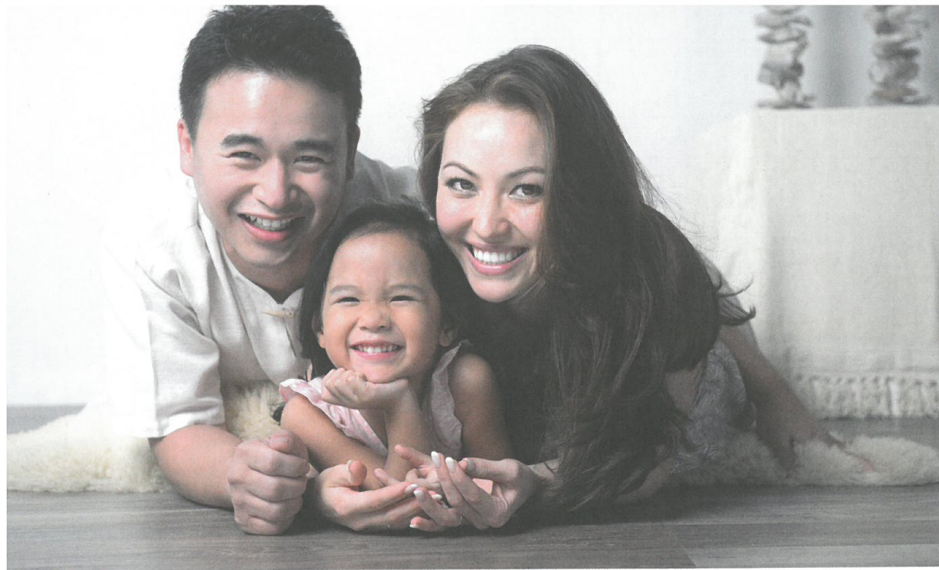
Menschen aus anderen Kulturen sollen glücklich wohnen können. Der Hauswart kann viel zu ihrer Integration beitragen.